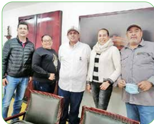
Articulación FEDECACAO y el Instituto Superior de Educación Rural del municipio de Pamplona - ISER