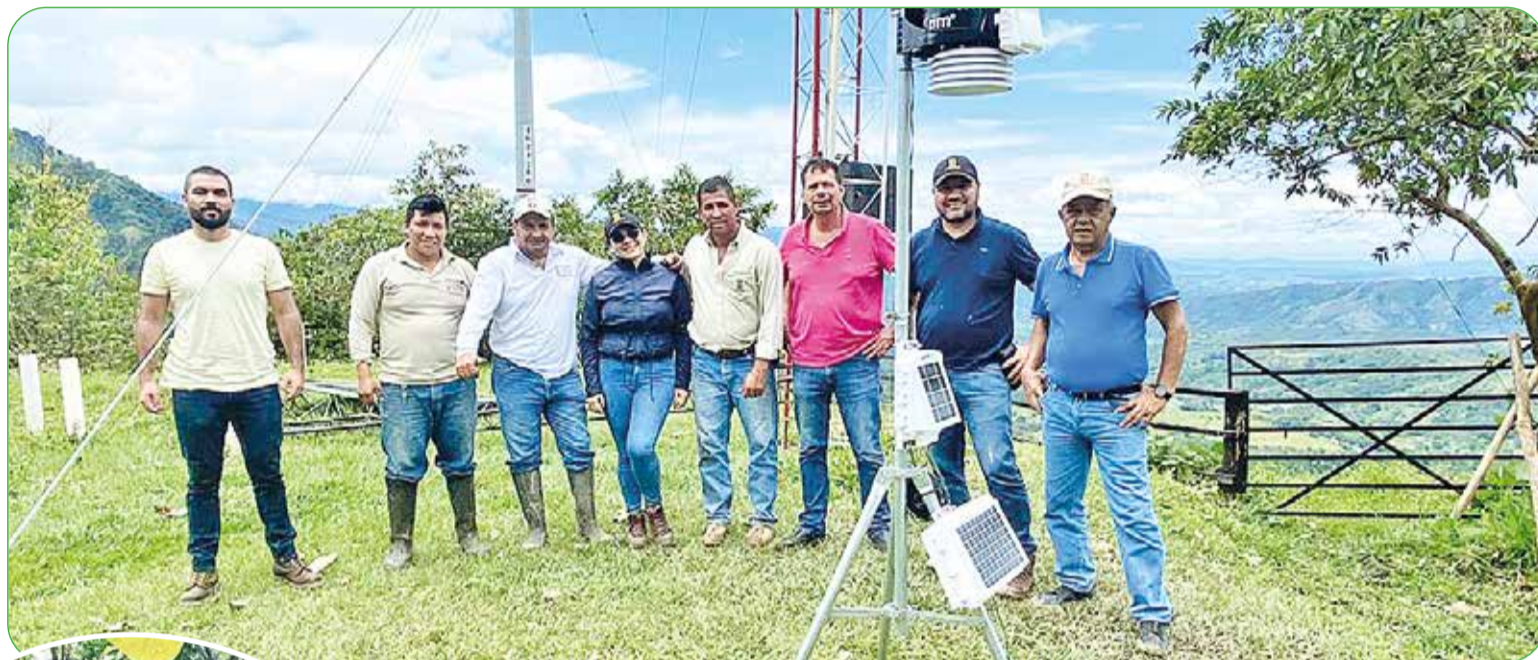
Estación meteorológica instalada en Chaparral (Tolima)

La agricultura climáticamente inteligente más conocido en el mundo como CSA por sus