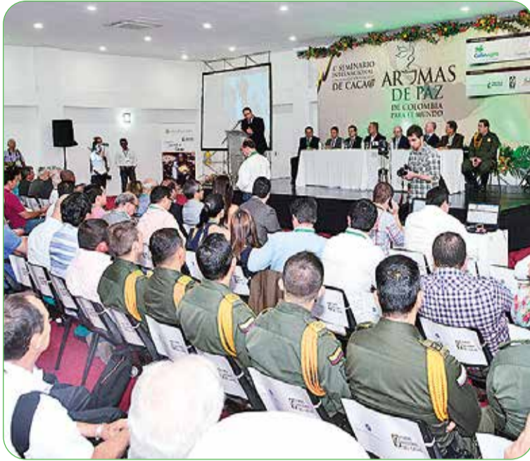
En 2016, se realizó el último seminario presencial, antes de la pandemia, en Floridablanca (Santander).

El evento será encabezado por el presidente de FEDECA-