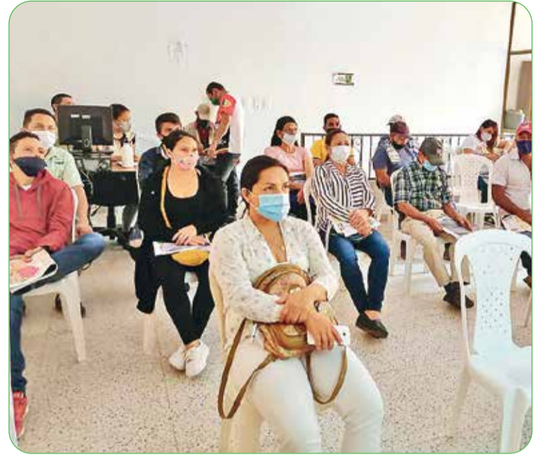
En 2020, también se llevó a cabo el seminario, en su quinta versión, pero por la pandemia se debió realizar de forma virtual.

En esta versión se espera la participación de cerca de 700 personas, que tendrán oportunidad de conocer de primera mano estas temáticas por parte de expertos nacionales e internaciona-