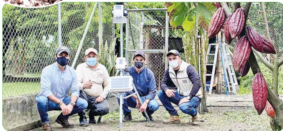
Equipo de FEDECACAO durante la instalación de la estación meteorológica en Miranda (Cauca)

siglas en inglés (Climate Smart Agriculture), es un enfoque que pretende llevar a cabo tres objetivos claros en la producción de alimentos bajo el contexto local y con los elementos dentro de la finca: mayor resiliencia, aumento de la productividad y la reducción de emisiones son las apuestas mencionadas.