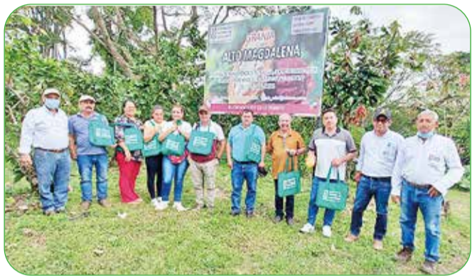
Demostración de método con concejales de Gigante