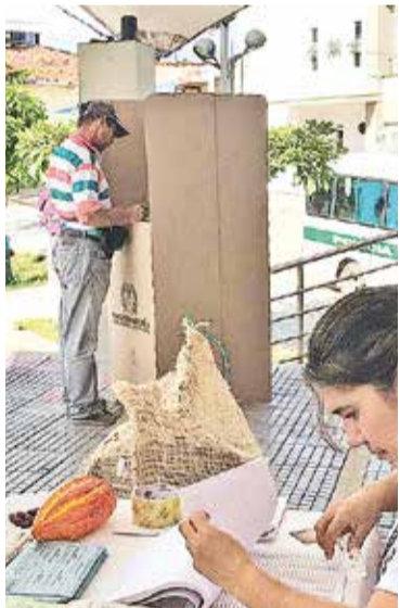
Una jurado de votación prepara el material electoral para las elecciones cacaoteras (El Carmen de Chucurí, 2018)

La Junta Directiva de la Federación Nacional de Cacaoteros convoca a todos los cacaocultores a inscribirse para participar en el proceso electoral del próximo 28 de agosto de 2022, para seleccionar a los aspirantes que integrarán las listas de los comités municipales, intermunicipales, departamentales, los representantes de los cacaocultores ante el comité directivo del Fondo de Estabilización de Precios del Cacao - FEPCACAO y delegados al XXXIII Congreso Nacional Cacaotero, donde se elegirá a la Junta Directiva y el Comité de Ética y Garantías Electorales. El Congreso se celebrará en la ciudad de Bogotá, los días 23 y 24 de noviembre de 2022.