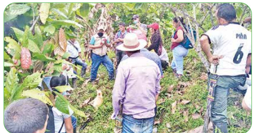
FEDECACAO apoya nuevas familias cacaocultoras del occidente de Boyacá