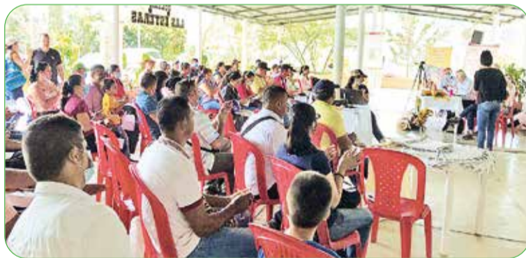
Capacitación sobre el seguro de lluvias para cacao en el municipio de El Carmen de Chucurí.