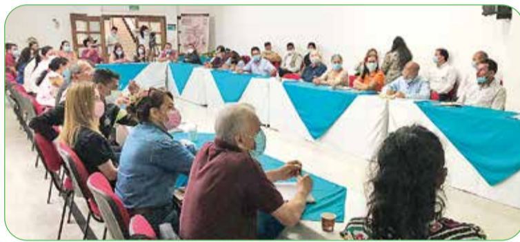
Taller sobre seguro paramétrico o de lluvias para cacao en Bucaramanga dirigido por los expertos del Consejo Consultivo de Finanzas Verdes procedentes de México, Argentina, Chile y Argentina.