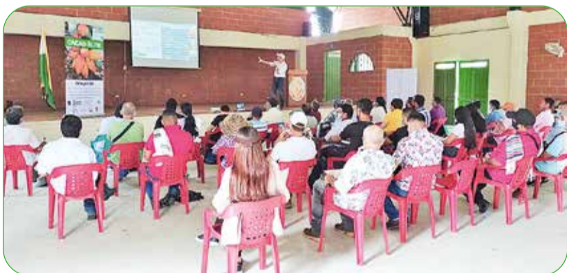
Socialización de resultados proyectos Sistema General de Regalías