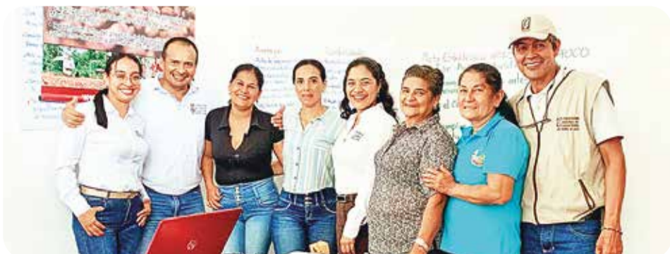
Trabajo del Programa de Fortalecimiento Socio-empresarial con énfasis en gestión estratégica y comercial, con las asociaciones CHOCOARTE'S (Teorama, Norte de Santander); ASOPROCAR (Rivera, Huila); ASOCACAOPLAT (La Plata, Huila) y AMOCAL (Chaparral, Tolima).