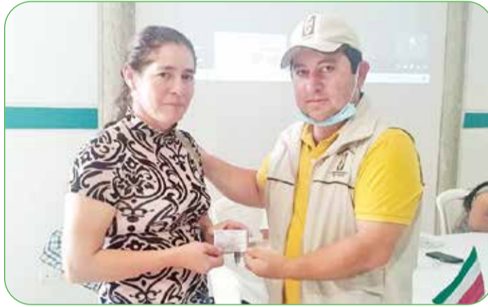
Jornada de cedulaación en Yacopí, donde tanto para Cundinamarca como para Boyacá se ha visto un incremento de la cedulaación de cacaocultores en un 30%.

Cabe resaltar que la garantía de representatividad genera un compromiso claro y fuerte frente al trabajo que se adelanta en la región, eso viene siendo fortalecido con el apoyo de su representante ante la junta directiva quien es elegido, igual que los miembros de los