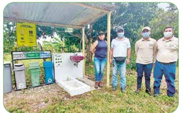
Certificación de fincas cacaoteras en BPA