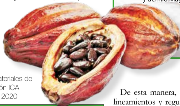
Tabla 1: Subregiones Naturales, materiales de cacao registrados bajo resolución ICA No. 67516 del 11 de mayo de 2020

Como complemento al registro de los nuevos materiales y siguiendo las actualizaciones normativas y la resolución ICA No. 67516 del 11 de mayo de 2020, la cual establece los requisitos para la inscripción de los cultivares en el Registro Nacional de Cultivares Comerciales, fue realizado el proceso para la ampliación del registro de cultivares de cacao en las subregiones naturales establecidas por el ICA (Tabla 1).