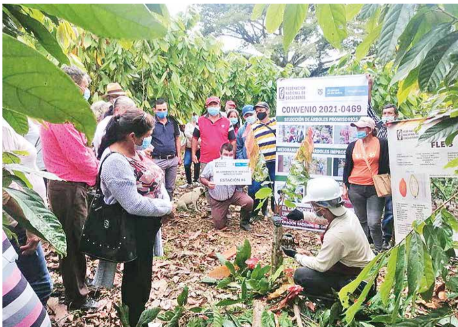
Municipio del Socorro, departamento de Santander, capacitación día de campo, mejoramiento de árboles improductivos, práctica despatronaje.

de acompañamiento técnico a los 4.000 productores beneficiarios del convenio, lograron realizar una identificación inicial de 593 árboles con características sobresalientes, a los cuales se les realizó asignación de código, caracterización morfoagronómica de sus descriptores, registro fotográfico y evaluación in situ. Tras una evaluación técnica por parte de los técnicos de campo y Jefes de Unidad, de los 593 árboles se seleccionaron 194. De estos, se priorizaron y seleccionaron 80 árboles promisorios de acuerdo con su potencial y cualidades evidenciadas en las tomas de información en campo. Estos últimos 80 árboles fueron clonados dentro de cada predio para garantizar la existencia de material vegetal suficiente para fases posteriores de estudio cuando estos árboles pasen a los