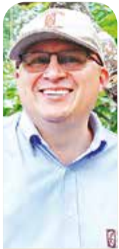
EDUARD BAQUERO LÓPEZ Presidente ejecutivo FEDECACAO

La situación que hoy enfrenta la cacaocultura no admite indiferencias ni dilaciones. Más de 65 mil familias en Colombia dependen su sustento de un cultivo que ha demostrado rigor técnico, calidad comprobada y una creciente presencia en mercados que valoran el origen y la excelencia del cacao colombiano. Entendemos la preocupación de los productores y estamos gestionando, con carácter urgente, todas las salidas posibles para mitigar el impacto y proteger el ingreso rural. Este es un momento que exige decisiones oportunas, articulación institucional y unidad del sector.