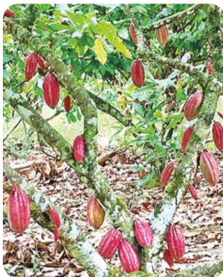
Cultivos productivos con el Modelo Araucano