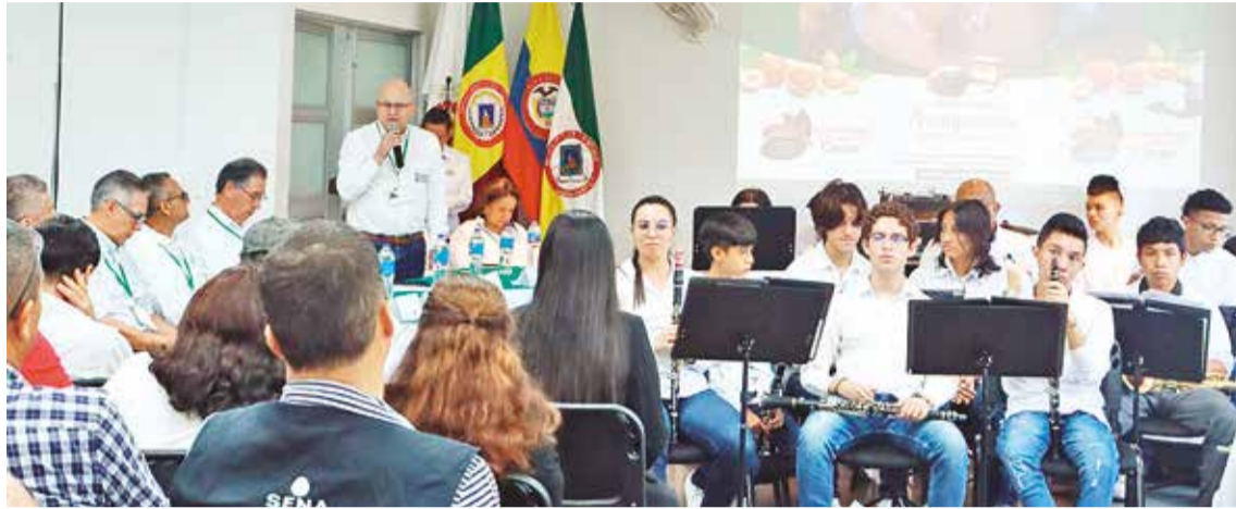
Evento de apertura de la Escuela en el Centro Agroindustrial del SENA (Armenia - Quindío)

La Escuela Nacional de la Calidad del Cacao es un centro dispuesto para la formación y la investigación, y sirve como soporte al cacaocultor, transformador y empresario a través de la prestación de los servicios tecnológicos, con equipamien-