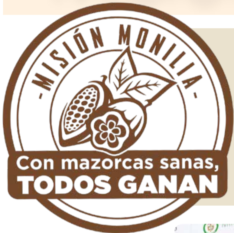
Sello oficial de la campaña

El Consejo Nacional Cacaotero lanzó en el marco del Día del Cacaocultor, el 19 de abril, una campaña nacional que busca sensibilizar a los cacaocultores del país sobre la importancia de controlar la enfermedad que perjudica al cacao, y que genera altas pérdidas en la cosechas, y de esta manera mejorar los ingresos a los productores