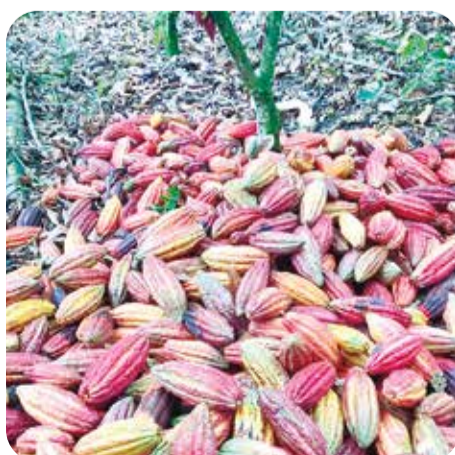
Cosecha sin monilla

4. Maderables, Luz y sombrío. utilizar la oportunidad de diseñar cultivos de cacao bajo sistemas agroforestales con diseños que permitan gran exposición de los árboles de cacao al sol, distancias y modelos de siembra de los árboles de maderas finas que permitan poco sombreado sobre el cacao lo que es el ideal en esta región por las condiciones del suelo que retiene humedad, facilita el crecimiento de las raíces y claro está, con mayor luz, alcanzar más producción de cacao, siempre y cuando