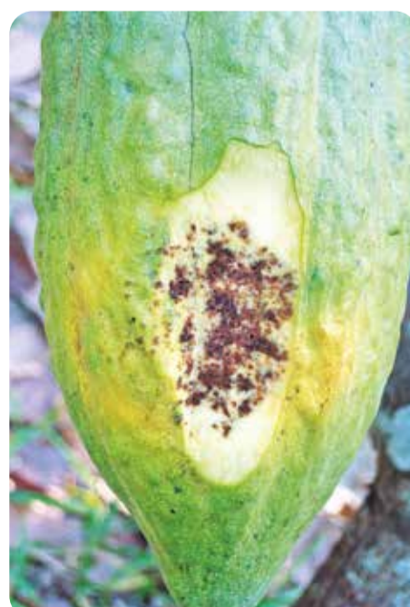
Frutos infectados por la enfermedad de la monilia, que en casos graves puede dañar el 80% de la cosecha