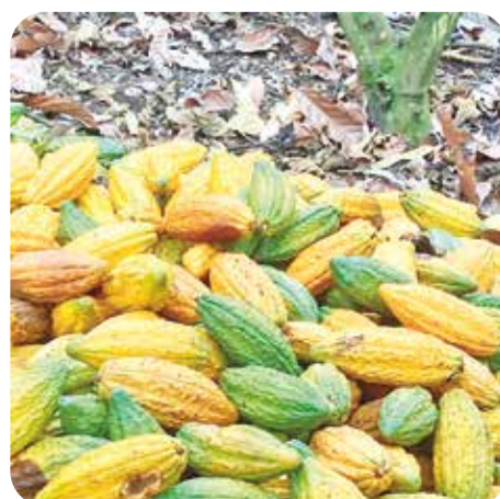
Cosecha y productividad

los aportes de agua y fertilizantes o la nutrición sean los adecuados.