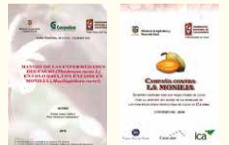
Antecedentes de campaña conjunta contra la Monilia, en cartillas de 2006 y 2010

3. En los últimos diez años, FEDECACAO ha impulsado la renovación de cacaotales envejecidos, con el fin de promover plantaciones modernas con alturas que no superen los 3.5 metros, con adecuada aireación y entrada de luz, que, sumadas a las labores agronómicas adecuadas de poda y control fitosanitario, logran una relación costo-beneficio positiva para las familias cacaocultoras, quienes comprueban que el costo de controlar la Monilia es bajo y los beneficios productivos y económicos muy altos.