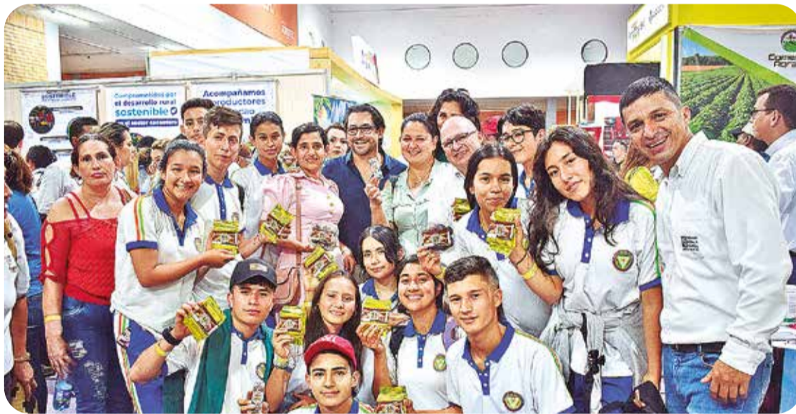
Los jóvenes del programa de FEDECACAO Inclusión Juvenil Cacaotera, provenientes de San Vicente de Chucurí (Santander), también ofrecieron los productos de su emprendimiento

programa de “Misión Monilia” donde se desarrolló un taller con los agricultores para identificar diferentes temáticas del ciclo biológico de la monilia, las prácticas de manejo en el cultivo y las consecuencias de la enfermedad en los procesos de la calidad de cacao tanto en grano como en producto transformado.