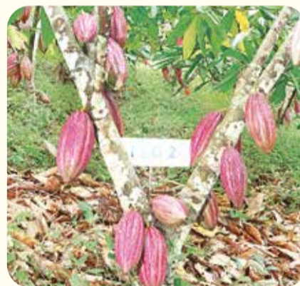
Material FEDECACAO El Carmen 2, desarrollado por FEDECACAO, hasta ahora el más resistente a la monilia.

1. A través del Programa de Investigación, se adelantó el Proyecto en el Manejo Integrado de Enfermedades con énfasis en la Moniliasis del Cacao, lo que condujo a la evaluación, selección y conservación de materiales de alto rendimiento en producción y calidad. Como resultado de esta investigación, se identificaron clones de cacao colombiano con alta tolerancia a la en-