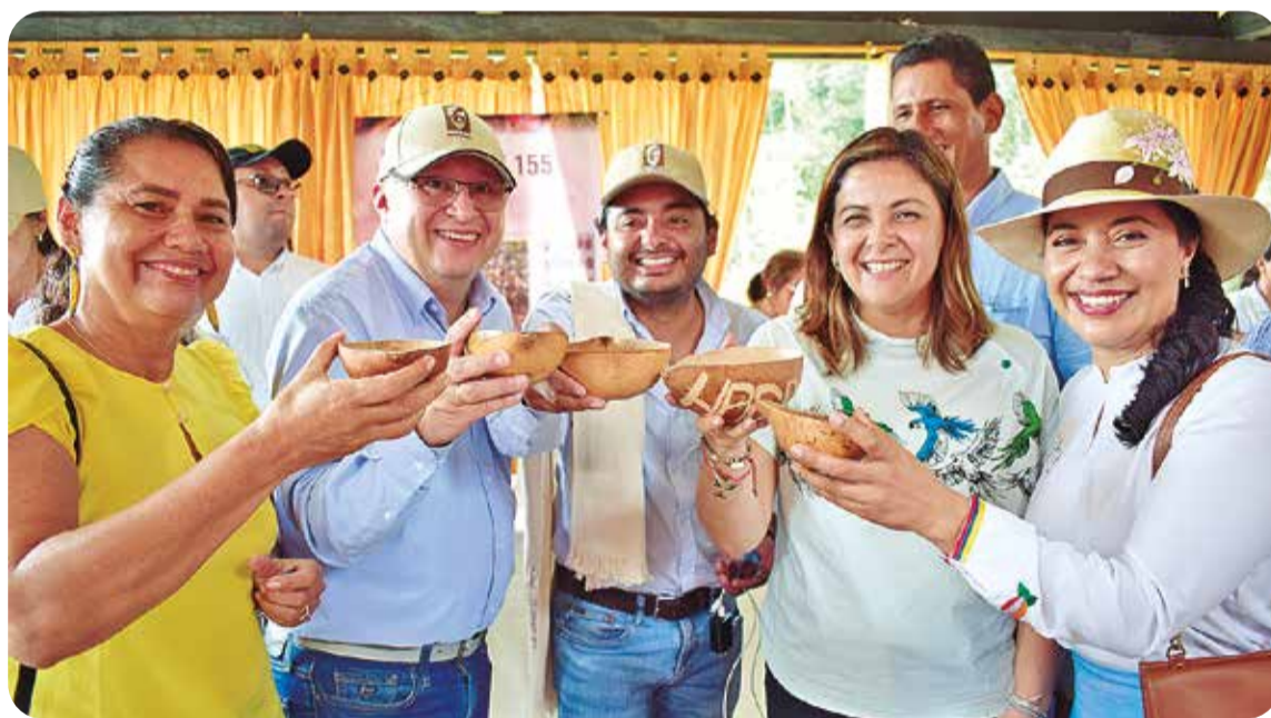
La ministra compartió con emprendedores de cacao en una muestra comercial