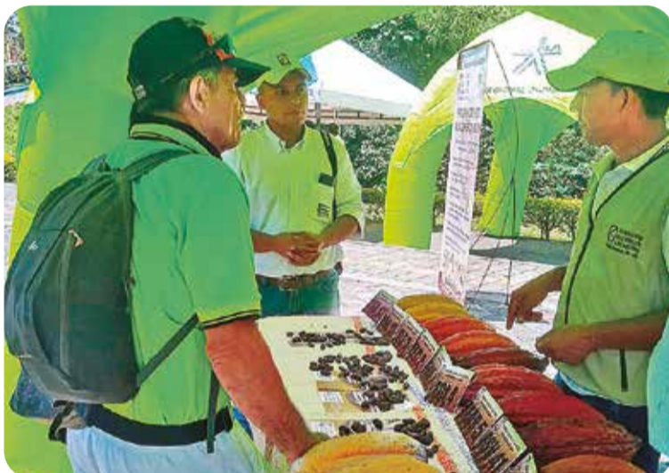
Con la Escuela Nacional de Calidad de Cacao en Quindío, los cacao-cultores del eje cafetero podrán conocer e identificar mejor las características físico-sensoriales del grano que comercializan.

sus programas para entregar un producto inocuo a la industria, que ofrece entre sus cualidades notas florales, frutales, nueces, caramelo, frutos cítricos, florales de hierbas aromáticas, malta, sabores suaves y agradables, cualidades que provienen de los materiales genéticos finos de sabor y aroma producto de años de investigación de FEDECACAO- Fondo Nacional del Cacao.