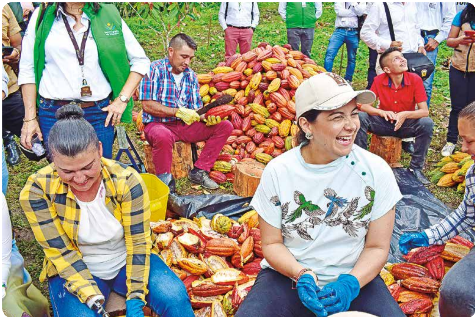
Durante la visita, la ministra disfrutó de un Día de Campo donde conoció los diversos aspectos del cultivo: siembra, cosecha, desengrullado, así como desarrollos en investigación, perfiles de cacao entre otros

La ministra tuvo ocasión de hacer un recorrido guiado por cinco estaciones a lo largo de la granja, en donde se desarrollaron temas como productos agropecuarios asociados al cacao, avances en investigación en cacao, desarrollo de sistemas agroforestales en el cacao, desengrullado de la mazorca y el poder de resiliencia de la mujer campesina, e incluso también degustó los diversos perfiles de sabor a par-